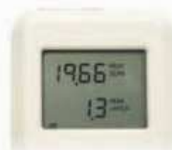
Muestra 2 parámetros del test