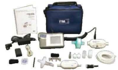
Sistema de pruebas de flujo alto 4080 con kit del sensor de oxígeno 4082