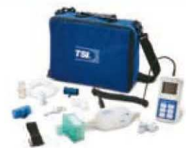
Sistema de pruebas de flujo alto 4070 con kit del sensor de oxígeno 4073